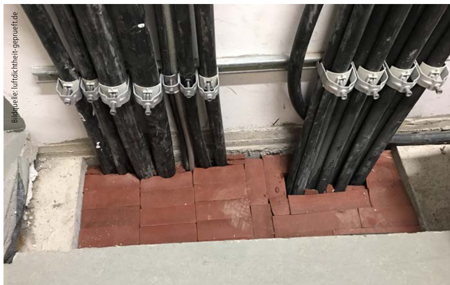
Viele Abschottungen erfüllen zwar die Anforderungen des Brandschutzes, sind aber nicht luftdicht.